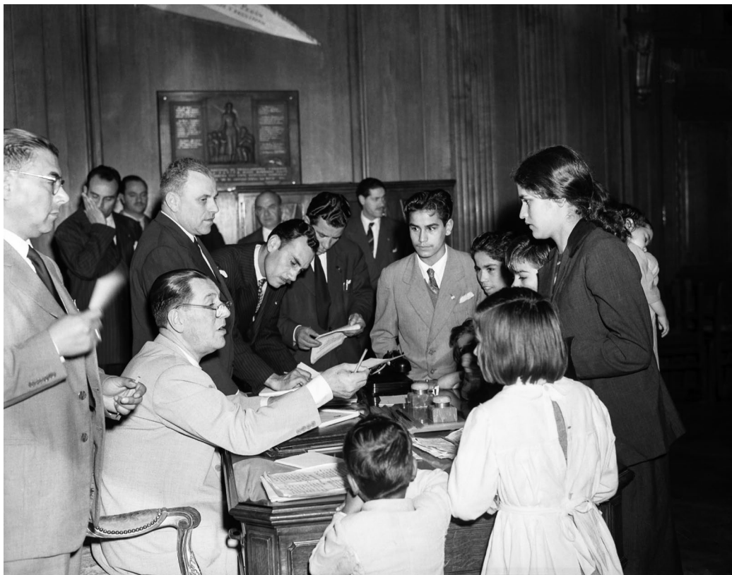
Perón atiende solicitudes de ayuda en el mismo despacho que ocupaba Evita en el Concejo Deliberante. Buenos Aires, diciembre de 1952.