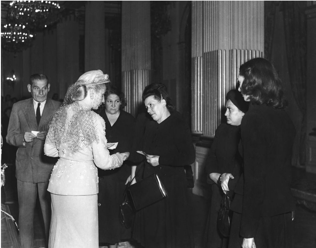
Eva Perón entrega pensiones a viudas del sindicato de choferes de taxis. Buenos Aires, 13 de abril de 1951.