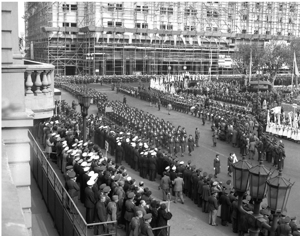
Desfile con abanderadas de la Escuela de Enfermeras "7 de Mayo", Fundación Eva Perón. Columna frente a la Casa de Gobierno. Buenos Aires, 25 de mayo de 1952.