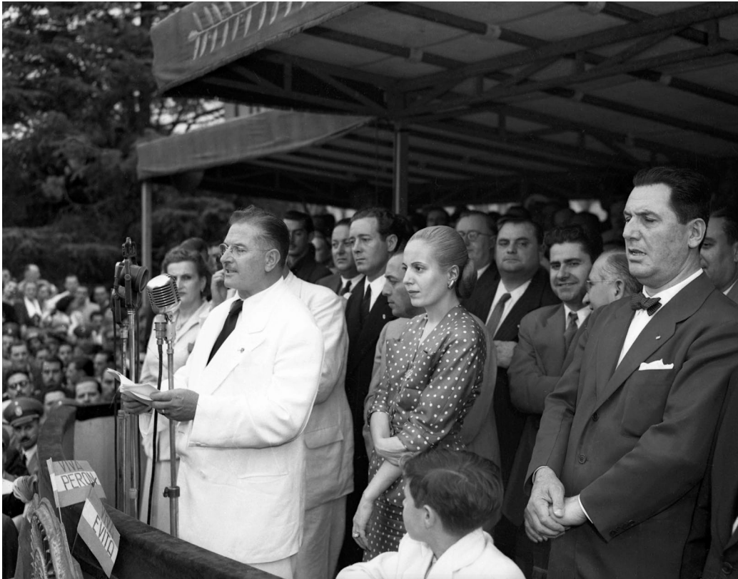
Eva y Juan Perón en la inauguración del Parque de los Derechos de la Ancianidad. Discurso del gobernador Domingo Mercante. Provincia de Buenos Aires, 24 de febrero de 1950.