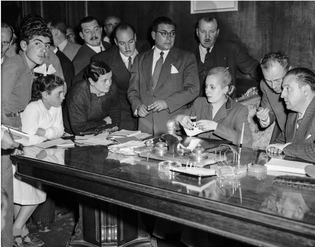
Evita atiende el pedido de una familia en su despacho del Concejo Deliberante. Buenos Aires, c. 1950.