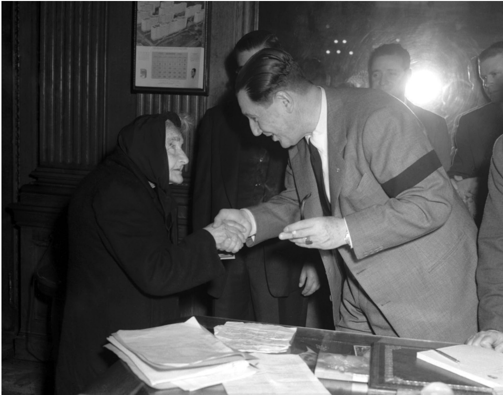
El general Perón —rodeado de sus colaboradores— atiende solicitado el pedido de una anciana. Buenos Aires, c. 1953.