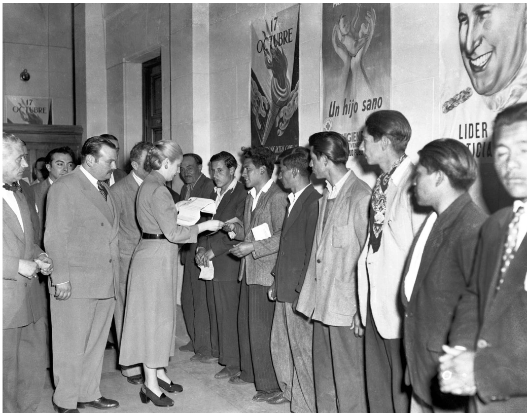
Eva Perón conversa con una delegación obrera del norte argentino. Buenos Aires, c. 1948. Fotógrafo no identificado.