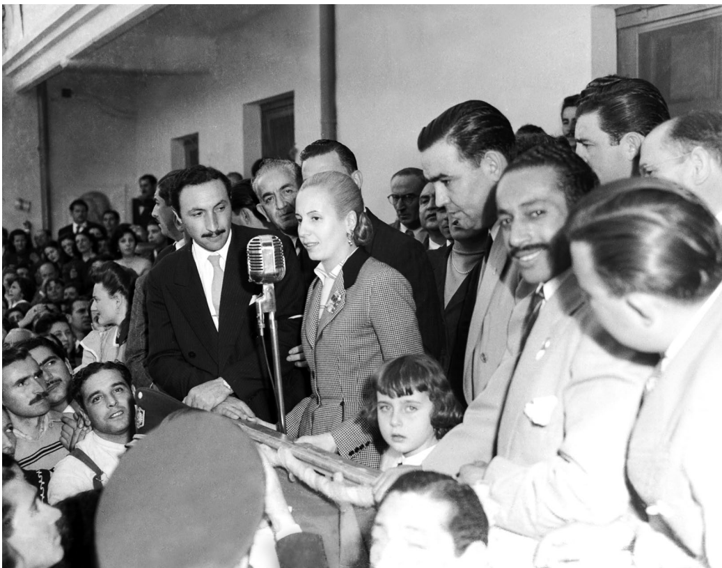
Trabajadores rodean a Eva Perón en su visita a una fábrica textil. Bernal, provincia de Buenos Aires, 12 de junio de 1951.