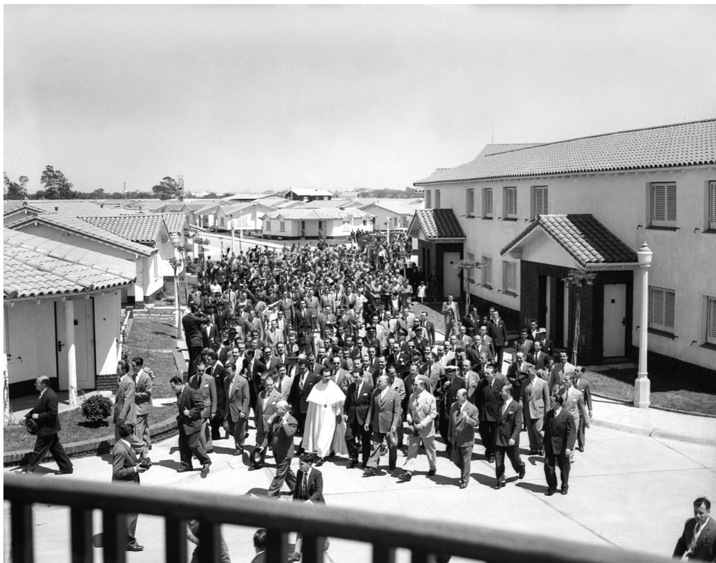
El presidente, ministros y otras autoridades visitan el flamante Barrio Juan Perón, actualmente Cornelio Saavedra. Buenos Aires, 10 de noviembre de 1949. Fotógrafo no identificado.