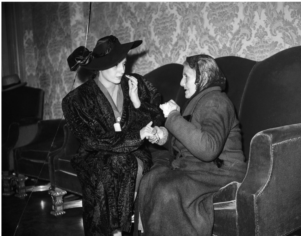
Evita atiende en su despacho la solicitud de una anciana. Buenos Aires, c. 1950. (Negativo de vidrio dañado sin restauración digital.)