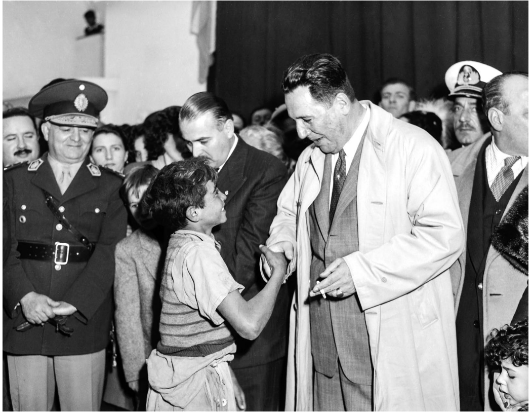
Inauguración de una escuela-fábrica en la localidad de Florida. Perón rodeado de funcionarios y docentes saluda a un niño. Florida (Vicente López), provincia de Buenos Aires, 10 de junio de 1956.