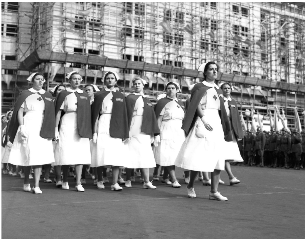
Desfile en Plaza de Mayo de la Escuela de Enfermeras "7 de Mayo", Fundación Eva Perón. Buenos Aires, 25 de mayo de 1952.