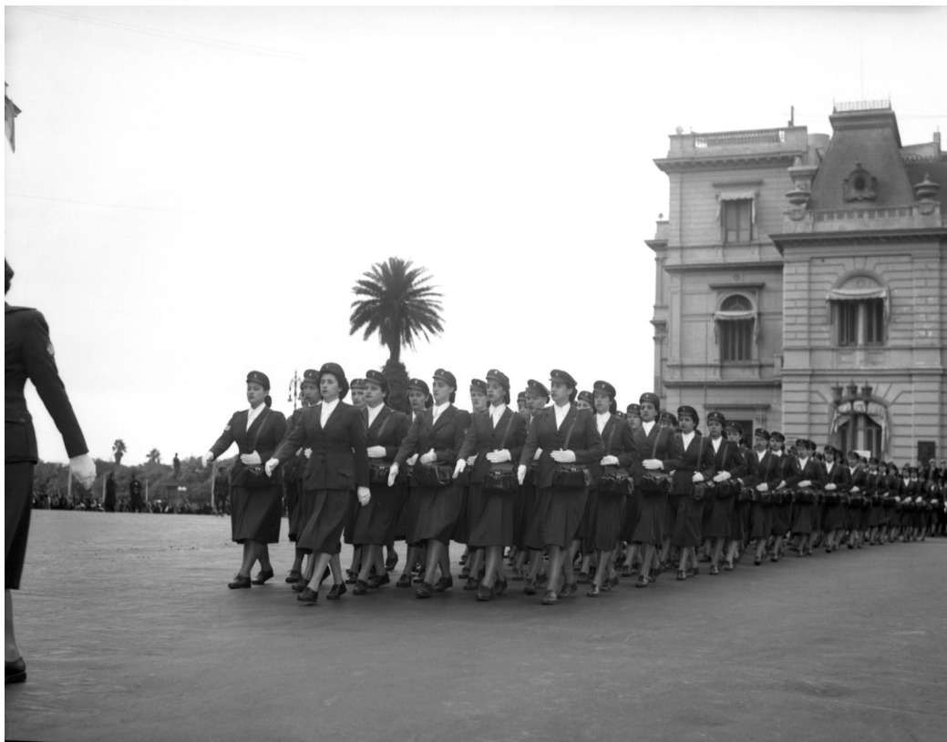
Desfile en columna de la Escuela de Enfermeras "7 de Mayo", Fundación Eva Perón. Al fondo el ala norte de la Casa de Gobierno. Buenos Aires, 25 de mayo de 1952.