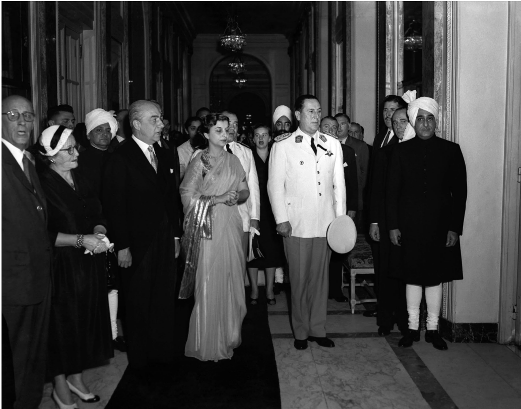
El presidente Juan Domingo Perón junto a la delegación de India en una exposición sobre aquel país asiático. Buenos Aires, febrero de 1950. Fotógrafo no identificado.