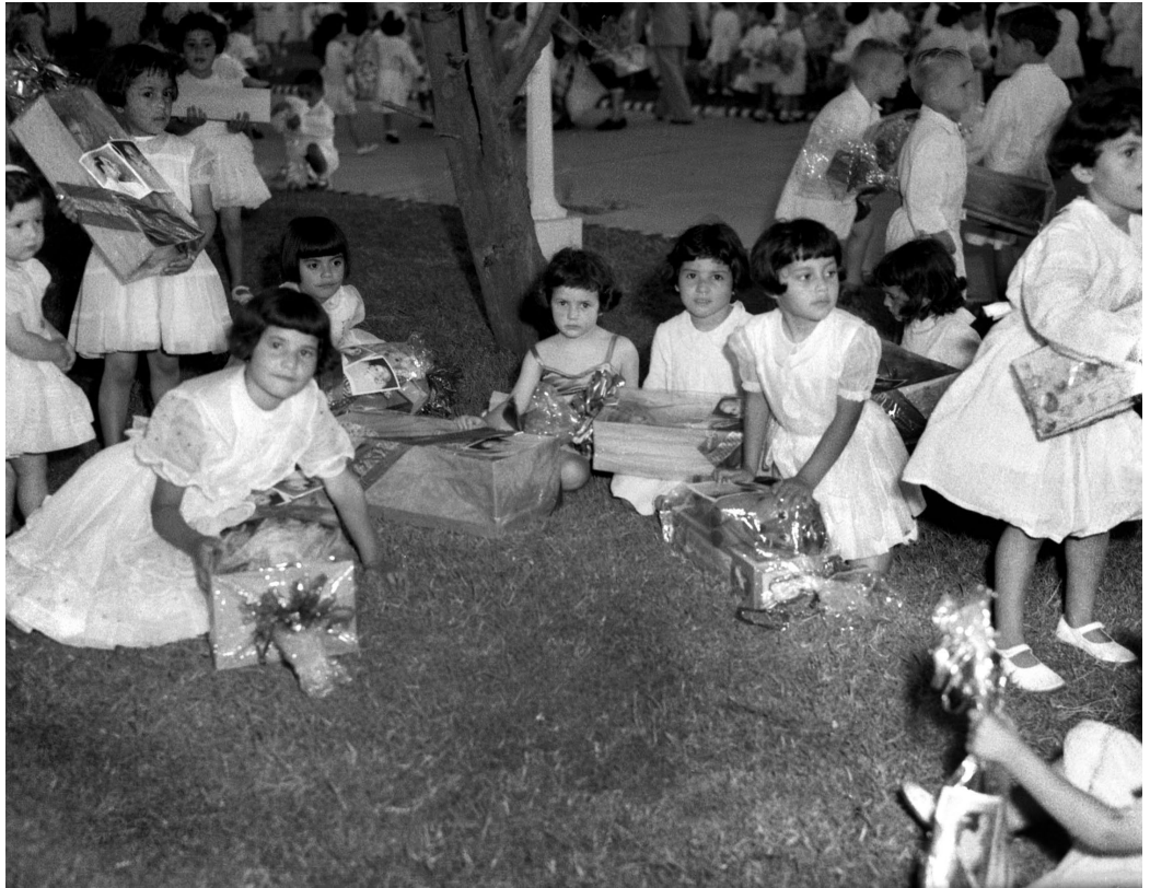
Acto de la Fundación Eva Perón. Grupo de niñas mostrando sus muñecas y otros regalos. Una de las tantas iniciativas a favor de la infancia promovidas por esta organización. Buenos Aires, 24 de diciembre de 1951.