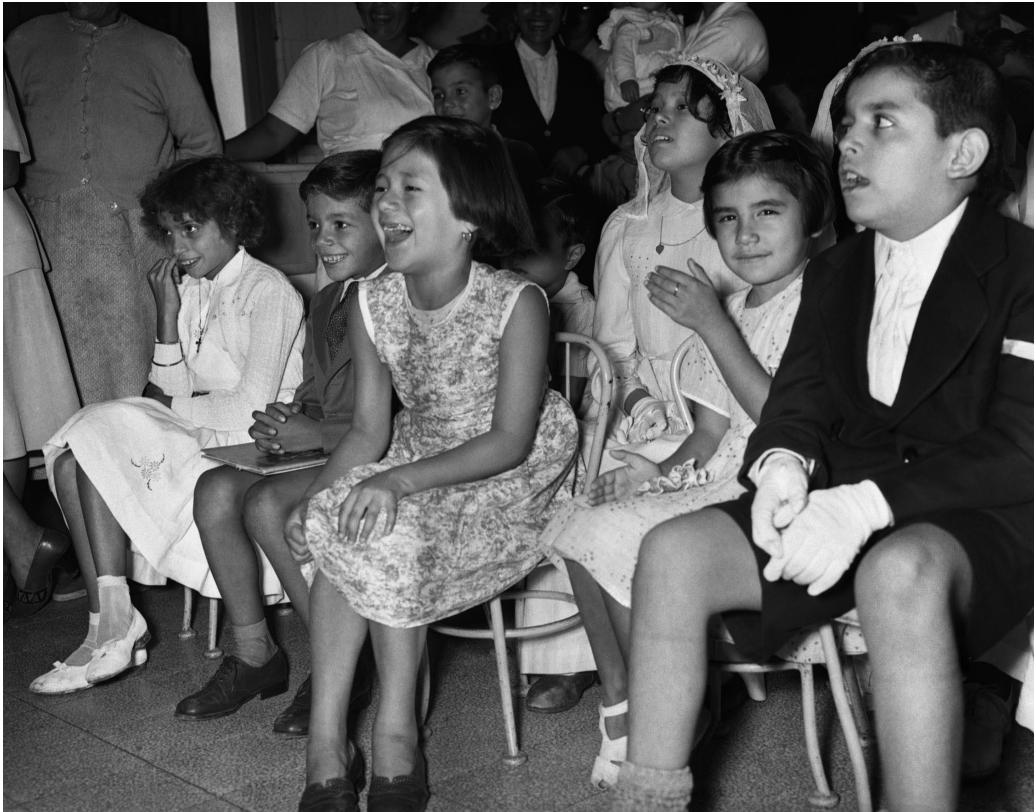
Niños en el Hospital Rawson –algunos de primera comunión– durante la celebración de los Reyes Magos. Fundación Eva Perón. Buenos Aires, 6 de enero de 1950.