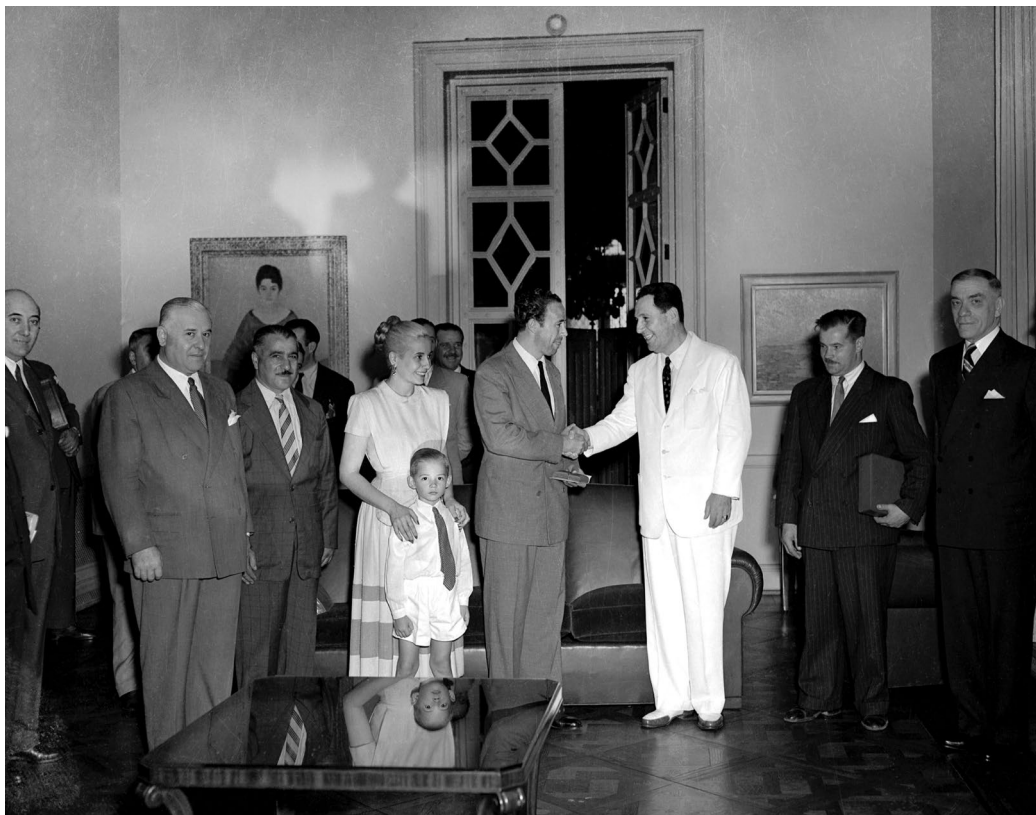
Juan y Eva Perón saludan a funcionarios de gobierno en el marco de la visita oficial realizada a la provincia de Entre Ríos. Paraná, provincia de Entre Ríos, diciembre de 1948.