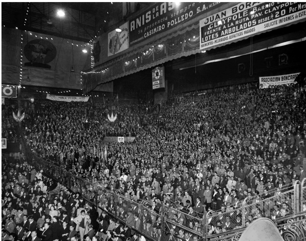
Masivo acto de empleados estatales en el estadio Luna Park. Se observan pancartas de adhesión de la Asociación Trabajadores del Estado (ATE) y de la Asociación Bancaria. Buenos Aires, 15 de abril de 1951.