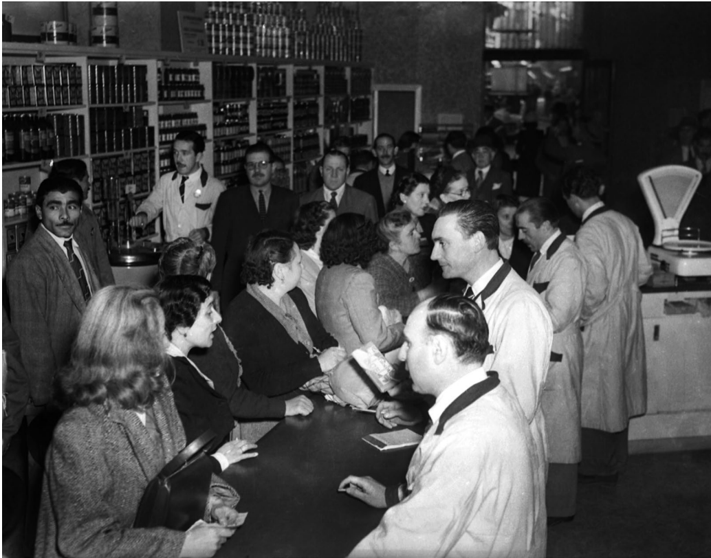
Interior de una de las 181 proveedurías de la Fundación Eva Perón. Su función era abastecer con artículos de primera necesidad y a precios reducidos a las clases más desprotegidas. Buenos Aires, 20 de abril de 1951.