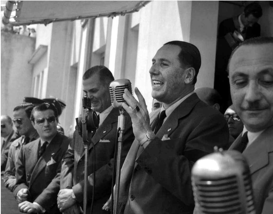
Discurso del presidente Perón desde el balcón de la Municipalidad de Lobos, su pueblo natal; a la izquierda, el gobernador de la provincia Carlos Aloé. Lobos, provincia de Buenos Aires, 25 de octubre de 1953.