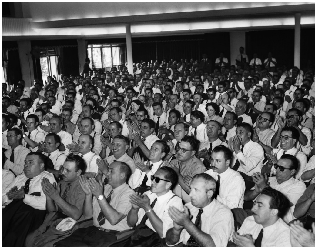
Delegados obreros asisten al acto de clausura del Congreso Confederado organizado por la conducción de la CGT. Buenos Aires, 9 de diciembre de 1954. Fotógrafo no identificado.