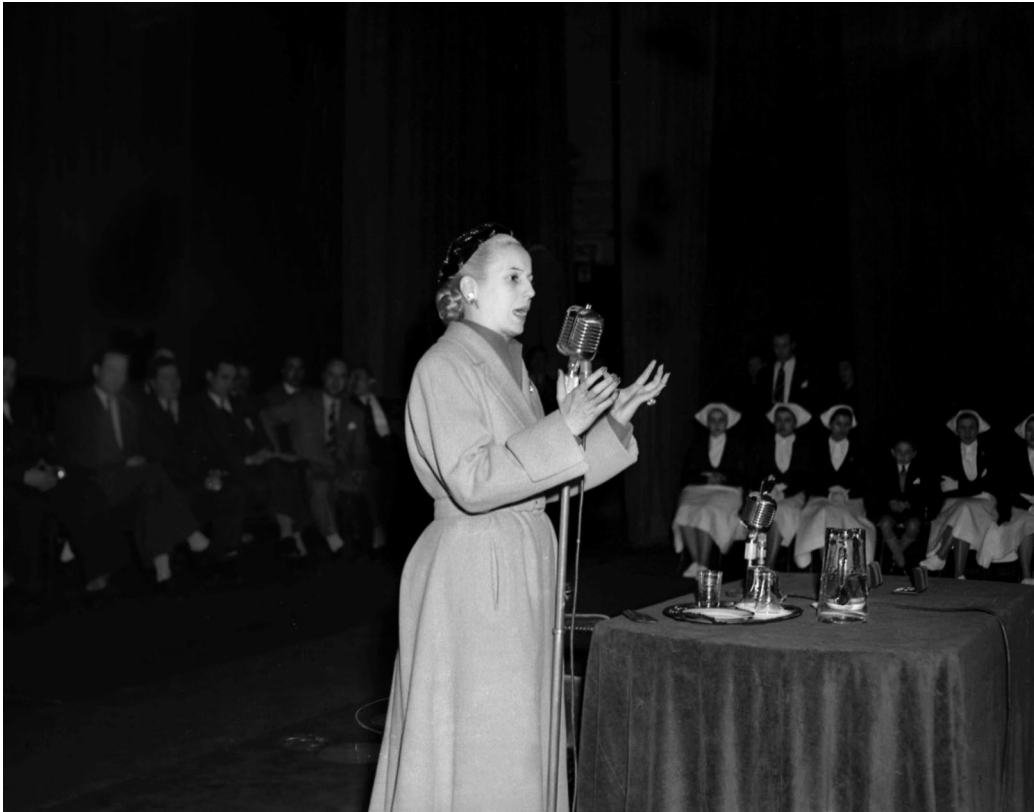
Emotivo discurso de la señora Eva Perón. En el acto asisten enfermeras de la Fundación Eva Perón. Buenos Aires, 17 de agosto de 1951.