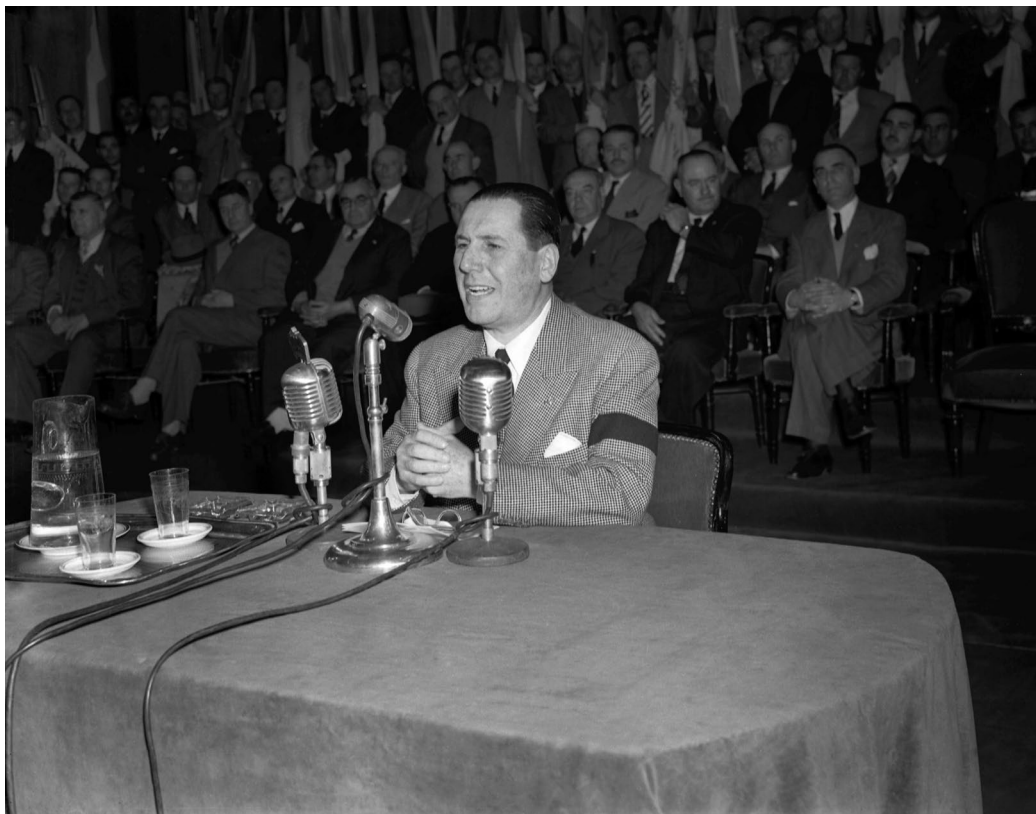
El presidente Perón dirige la palabra a los trabajadores del agro en un acto realizado en el Teatro Colón. En la manga del saco se observa el luto por la reciente desaparición de su esposa Eva. Buenos Aires, 13 de octubre de 1952. Fotógrafo no identificado.