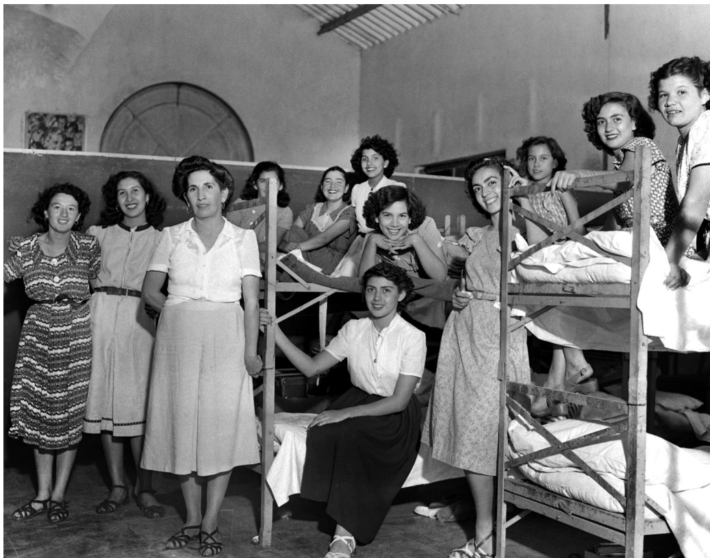
Jóvenes participantes de Educación Física provenientes de la provincia de Corrientes, sorprendidas por el cronista gráfico en el dormitorio común. Buenos Aires, 17 de marzo de 1950. Fotorógrafo no identificado.