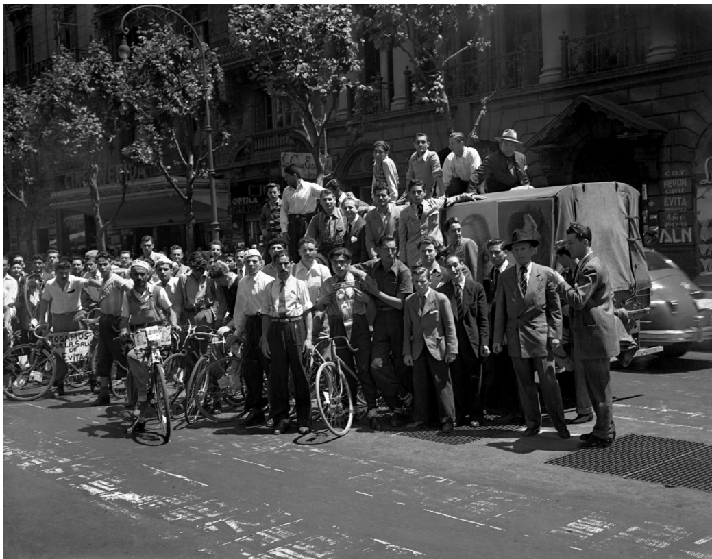
Grupo de manifestantes —algunos de los cuales se movilizan en bicicleta— se agrupan sobre la Avenida de Mayo pidiendo por la recuperación de la salud de Evita. Buenos Aires, 1952.