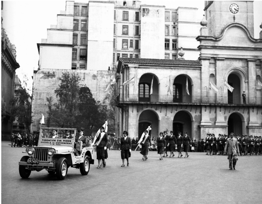
Desfile de la Escuela de Enfermeras "7 de Mayo" de la Fundación Eva Perón durante los festejos patrios del 25 de Mayo. Al fondo, el histórico Cabildo de Buenos Aires. Buenos Aires, 25 de mayo de 1952.