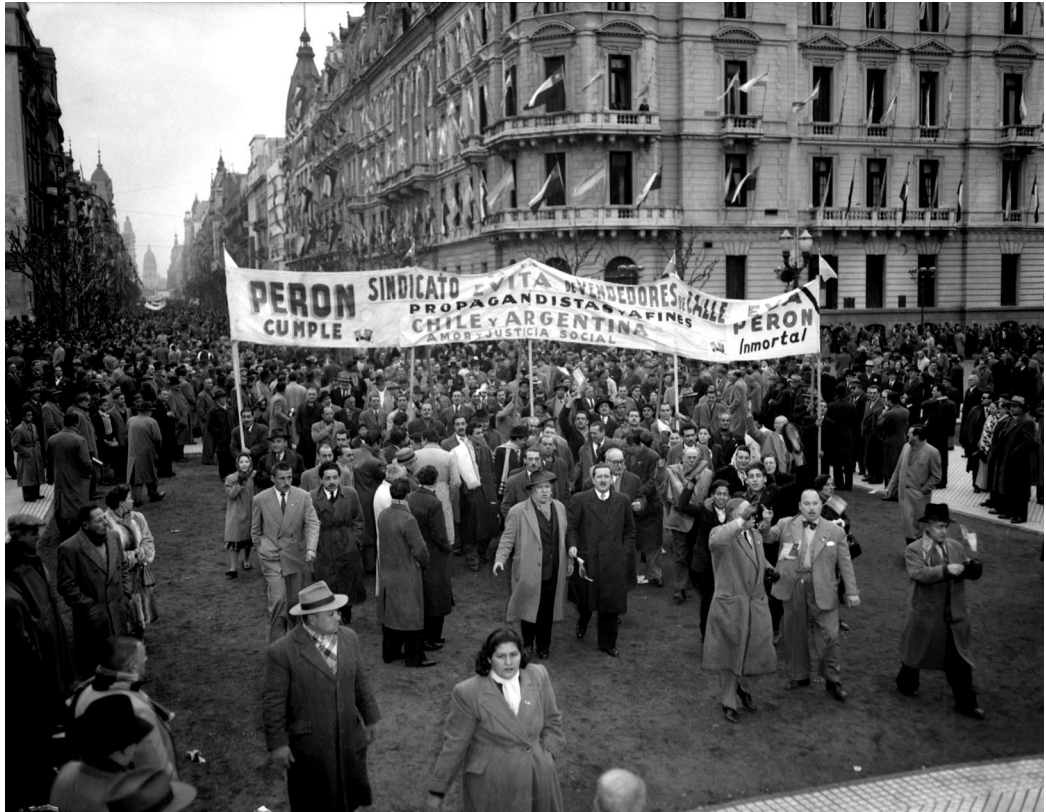
Columnas de manifestantes arriban al acto popular en Plaza de Mayo con motivo de la visita del presidente de Chile, general Carlos Ibáñez del Campo. Columna con pancarta del Sindicato Evita de Vendedores de Calle, Propagandistas y Afines. Buenos Aires, 6 de julio de 1953.