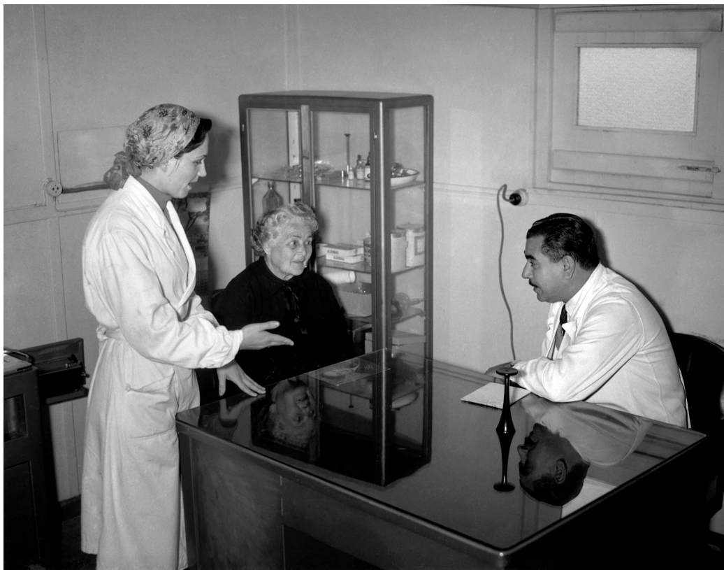
Paciente en el consultorio médico del Sindicato de Taxis. La salud pública fue una de las grandes prioridades del gobierno de Juan D. Perón. Buenos Aires, c. 1954.