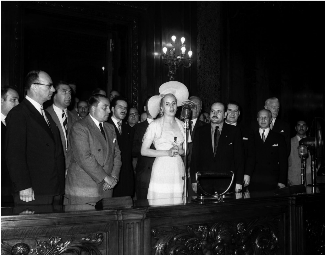
Eva Perón pronuncia un discurso en la Secretaría de Trabajo y Previsión. Luce en su elegante vestido blanco la Medalla Peronista. A la izquierda se encuentra el ministro Ramón Cereijo. Buenos Aires, c. 1950.