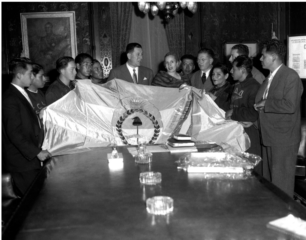
Juan Domingo Perón, Eva Perón y Domingo Mercante reciben en Casa de Gobierno a una delegación deportiva de Bolivia. Buenos Aires, 20 de julio de 1950.