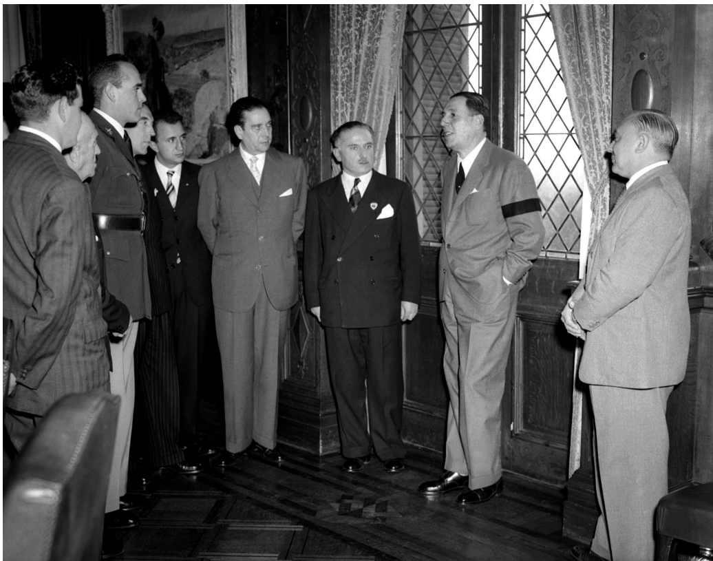
El presidente Perón dialoga de manera informal con un grupo de visitantes en uno de los salones de la Casa de Gobierno. Lo acompaña el ministro Rodolfo Valenzuela. Buenos Aires, 2 de junio de 1953.