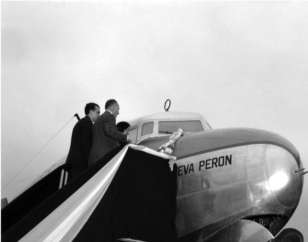
Bautismo de la aeronave Eva Perón en el Aeroparque "17 de Octubre" de la ciudad de Buenos Aires. Buenos Aires, 6 de julio de 1950.