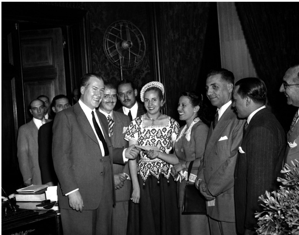
Eva Perón y el ministro Alfredo Gómez Morales reciben una donación con destino a la Fundación Eva Perón. Buenos Aires, 26 de diciembre de 1949.