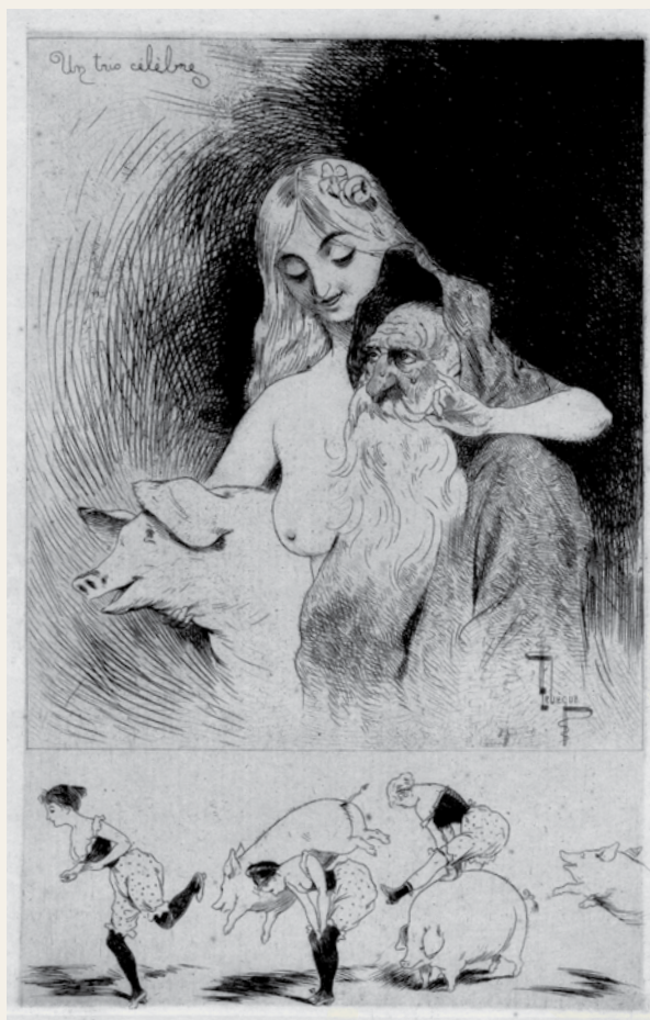
Un trio célèbre Lebègue