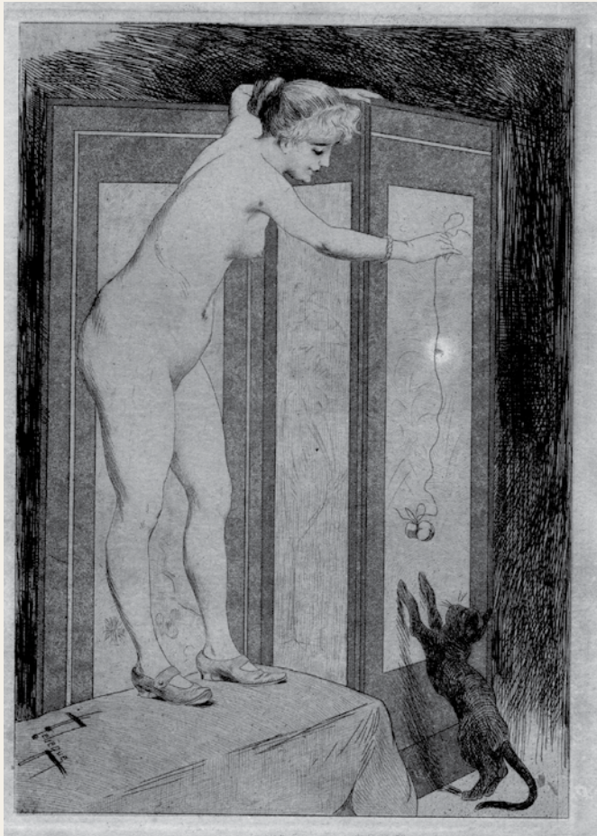
Femme nue et le chien Lebègue