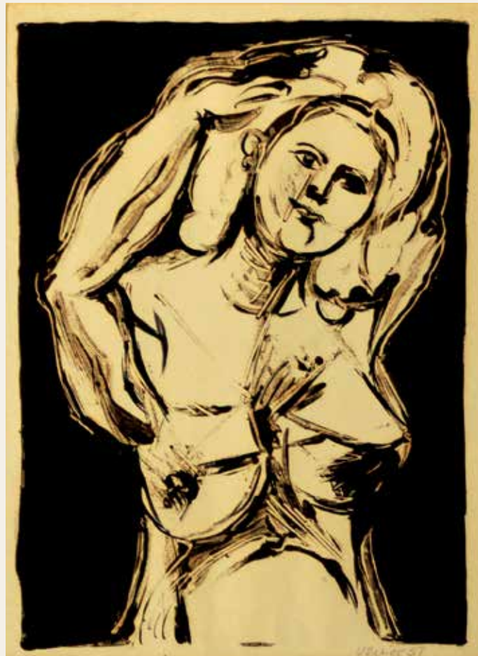
Eugenia haciendo la toilette Venier