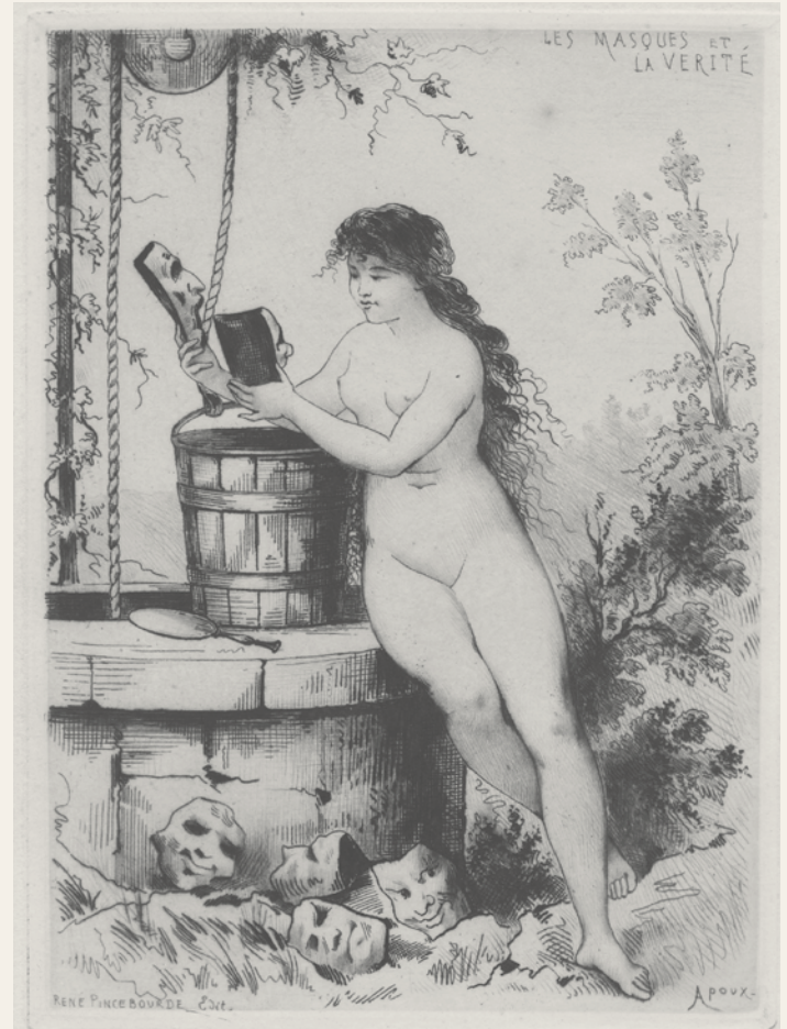
Les masques et la vérité Apoux

Observamos influencia de los grabados japoneses en Henry de Sta, en una litografía en la que ningún detalle queda de lado. Chauvet, Ulm y algunos grabados de autor no identificado completan este recorrido. La mujer objeto, la mujer picardía, la mujer ironía, su sensualidad y desenfado quedan plasmados en estas piedras preciosas de fin de un siglo decadente, idealista, trágico y teatral.