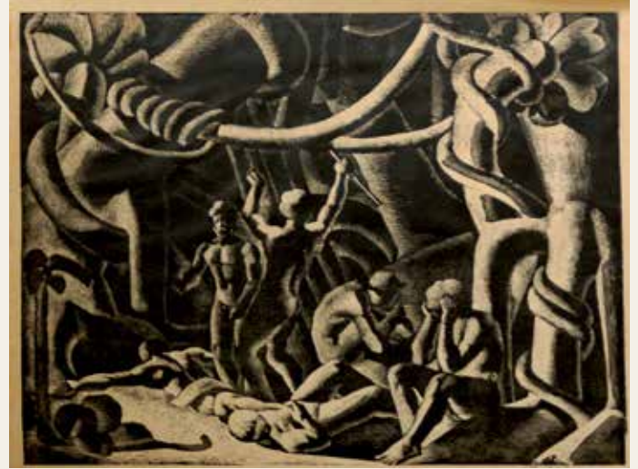
La justicia Federichi