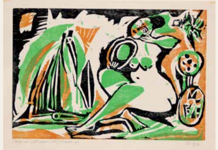
Primer grabado Forte